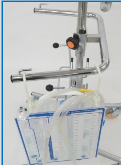
胸腔ドレーンハンガー FKH-24TSD2