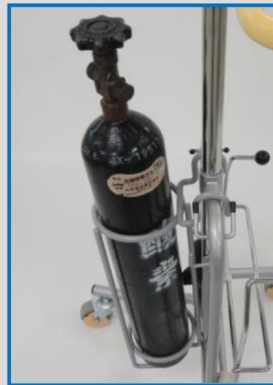
酸素ボンベハンガー FKH-24TSB