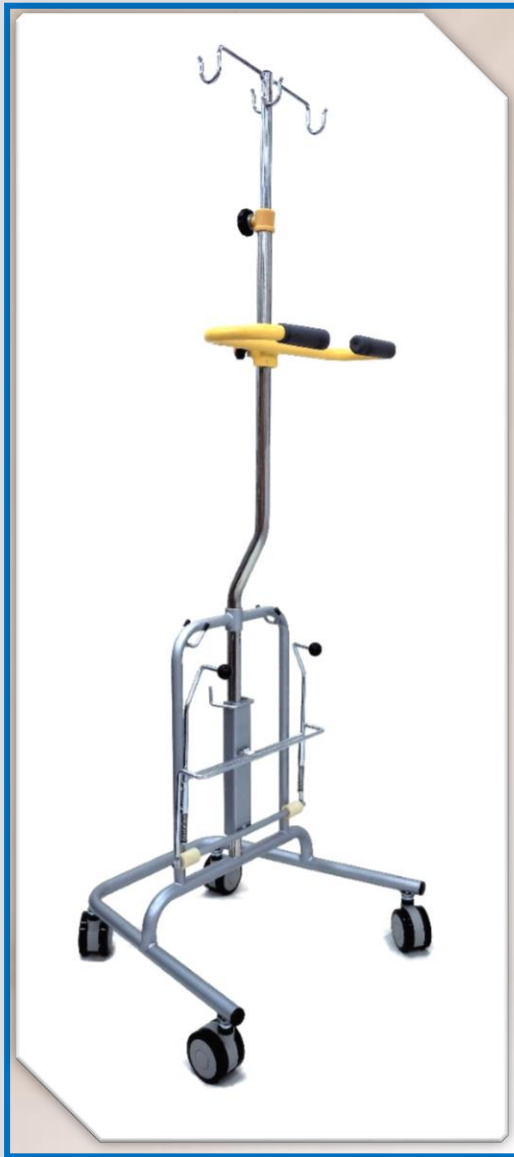
スタンダードタイプ FKH-24TSKH