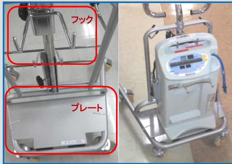
低圧持続吸引器・プレート・フック